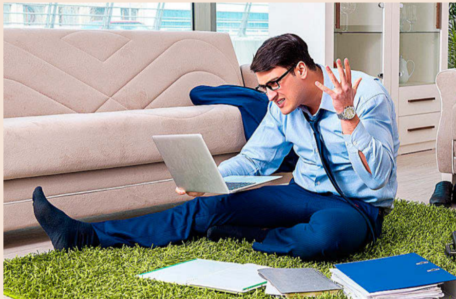
El Covid ha acelerado la digitalización y las empresas ofrecen vías para trabajar de forma más flexible.

El estudio identifica 14 tendencias, clasificadas en cuatro ámbitos: contexto global, reputación y marca, sostenibilidad, y ética y transparencia. Las expectativas sociales en un entorno de incertidumbre lidera las prioridades de los directivos, con 8,6 puntos de los diez posibles. El informe destaca que “la incertidumbre y la desconfianza general hacia las instituciones caracterizan la nueva normalidad ”